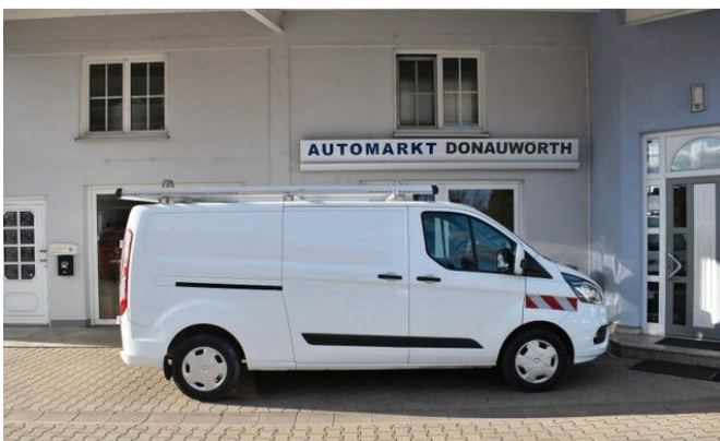
Bild vorab - Fahrzeug wird noch aufbereitet