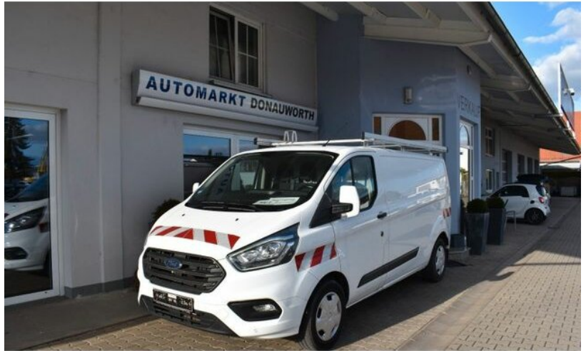
Bild vorab - Fahrzeug wird noch aufbereitet