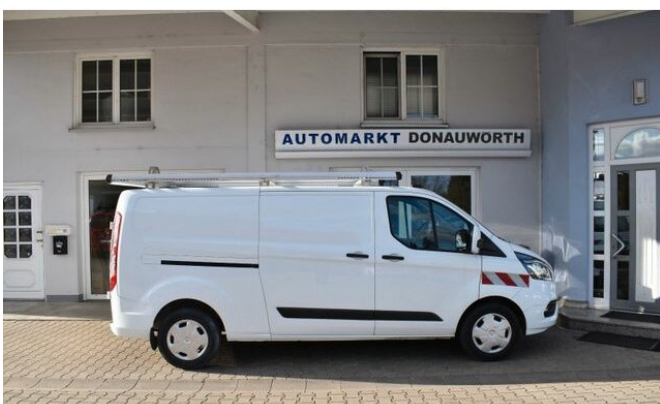
Bild vorab - Fahrzeug wird noch aufbereitet