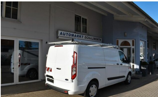
Bild vorab - Fahrzeug wird noch aufbereitet