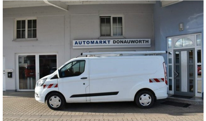
Bild vorab - Fahrzeug wird noch aufbereitet