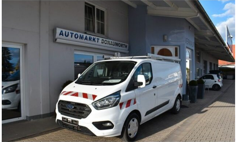
Bild vorab - Fahrzeug wird noch aufbereitet