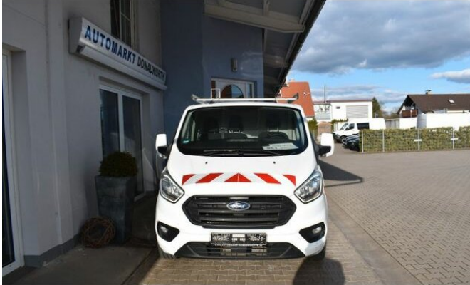
Bild vorab - Fahrzeug wird noch aufbereitet

Transit Custom Kasten 320 L2H1 Trend Sortimo Kli