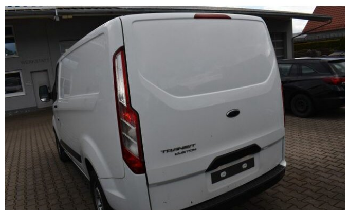
Bild vorab - Fahrzeug wird noch aufbereitet