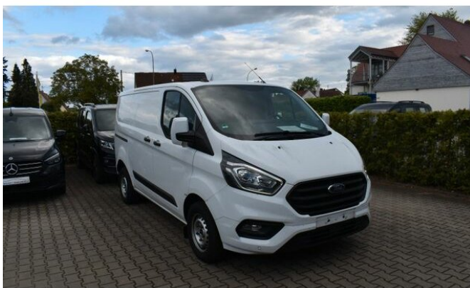
Bild vorab - Fahrzeug wird noch aufbereitet