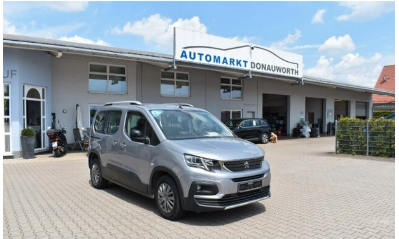
Bild vorab - Fahrzeug wird noch aufbereitet