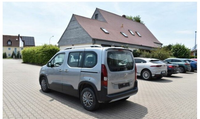
Bild vorab - Fahrzeug wird noch aufbereitet