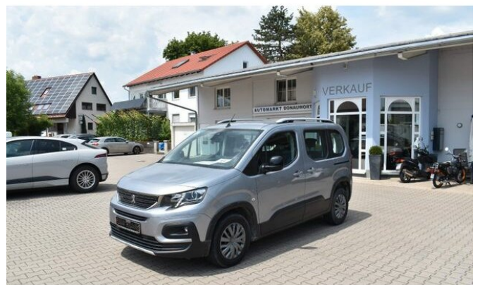
Bild vorab - Fahrzeug wird noch aufbereitet