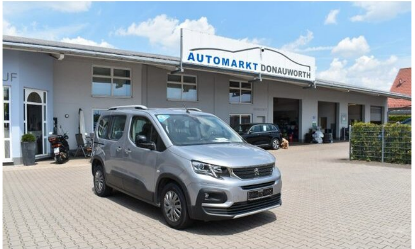
Bild vorab - Fahrzeug wird noch aufbereitet