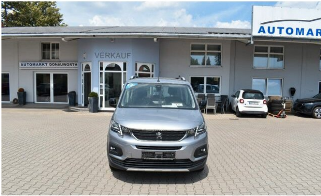
Bild vorab - Fahrzeug wird noch aufbereitet