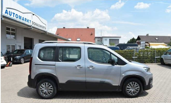
Bild vorab - Fahrzeug wird noch aufbereitet

BlueHDI 100 Allure Navi Standhgz Camping...